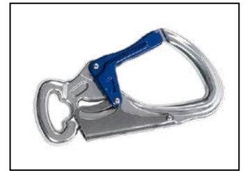
IKV 11 (EN 362:2004-T)